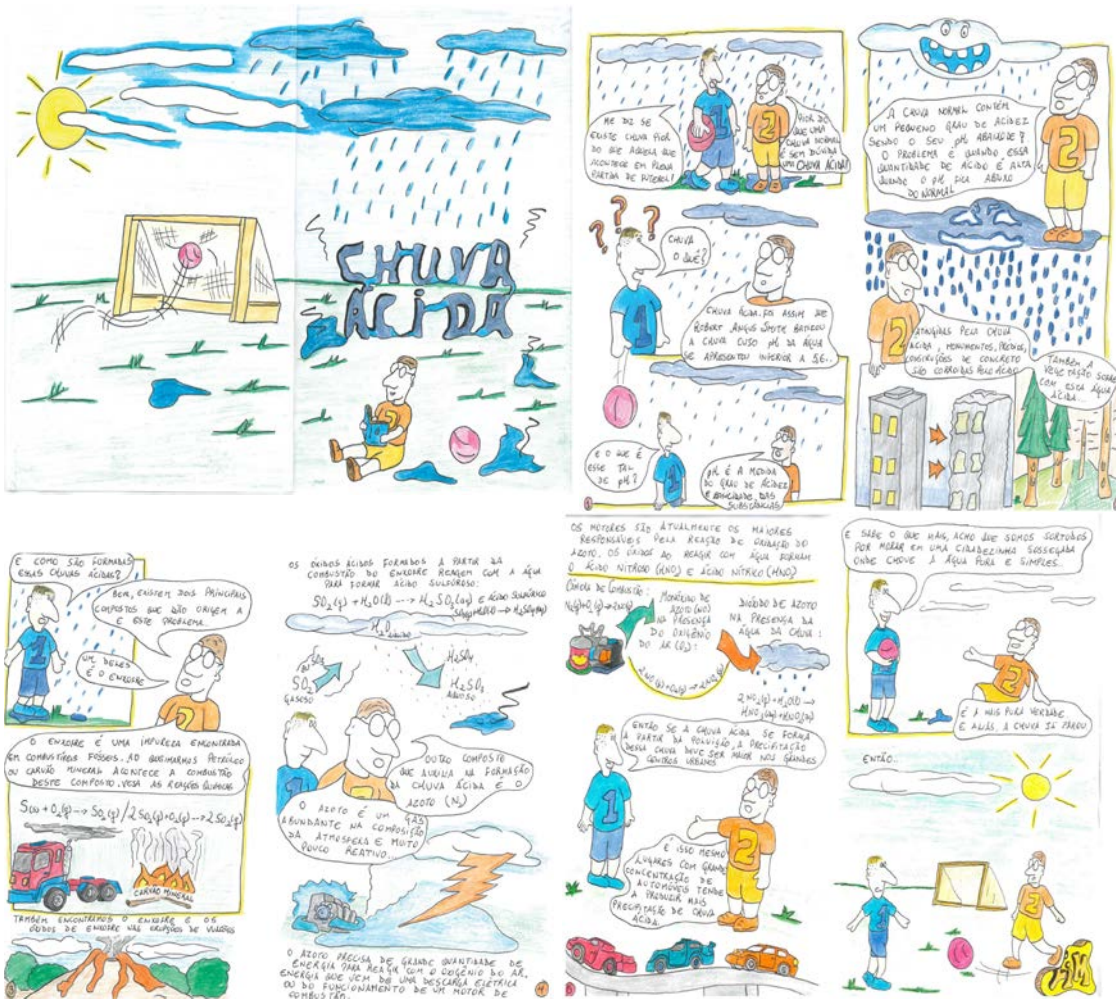
Figura 3.- História em quadrinhos: chuva ácida (Aluno A12).