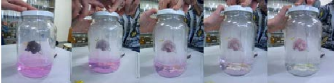
Figura 1.- Processo de formação da chuva ácida e mudança de coloração e aspecto de uma flor.

Os alunos, distribuídos em equipes, simularam o processo de uma chuva ácida, montando um sistema adaptado com uma flor suspensa na tampa de um vidro de conserva, contendo água, solução alcalina (detergente) e indicador fenolftaleína, identificando, assim, após a realização do experimento, uma mudança na coloração da solução, de rósea para incolor, e também a mudança de coloração e do aspecto da flor (Figura 1).