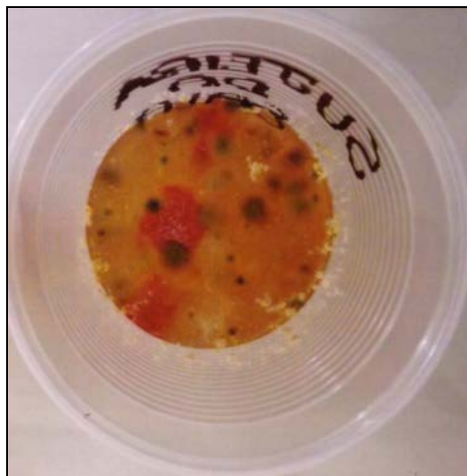
Figura 1.- Experimento "Cultivando bactérias e fungos".

A experimentação também foi utilizada na etapa de construção de argumentos: a professora e os alunos fizeram o experimento "Cultivando fungos e bactérias" (adaptação do material do site da Revista Escola, 2012), que teve como objetivo mostrar a existência de fungos e bactérias em nós e no ambiente diário, bem como o seu desenvolvimento no meio de cultura (solução preparada a partir de caldo de carne, que possui nutrientes necessários ao desenvolvimento desses seres vivos). A Figura 1 mostra o resultado do experimento.