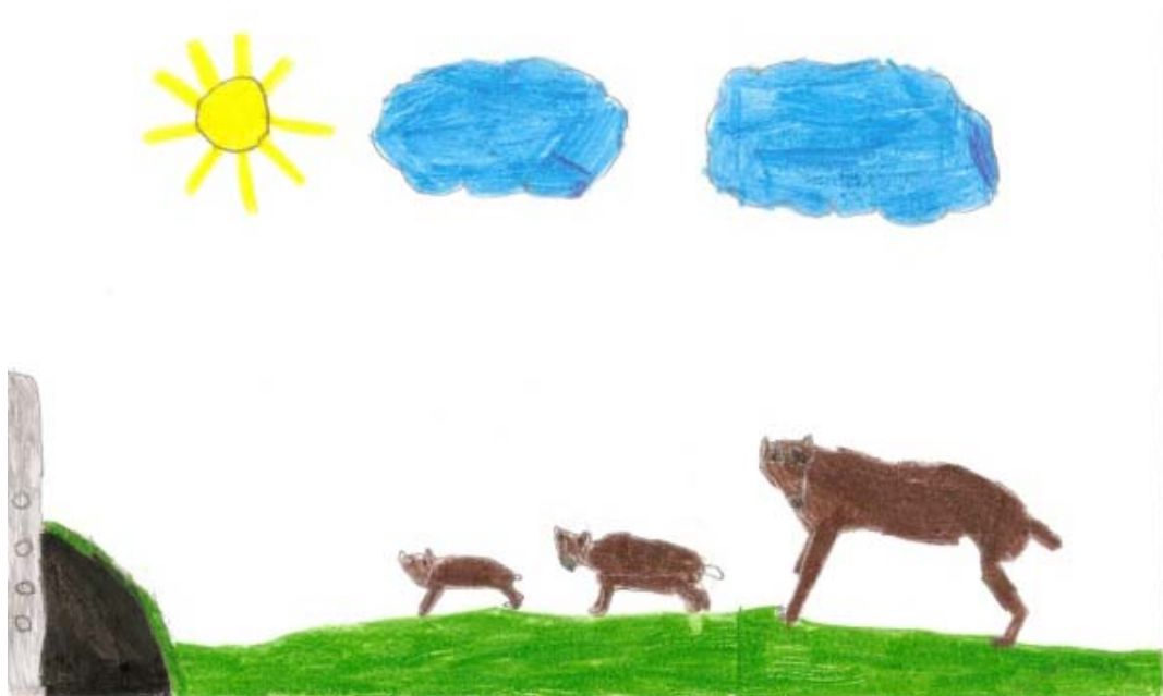
Figura 4.- Desenho de um lobo em alcateia feito por um aluno do 1.º ano.

A percentagem de alunos que elaborou desenhos com a localização do lobo no planisfério é de 5% (n=8). Verificou-se que os alunos não representaram de uma forma significativa "O lobo em cativeiro" (n=4), "O lobo e o caçador" (n=2) e "A reprodução do lobo" (n=2; Figura 5).