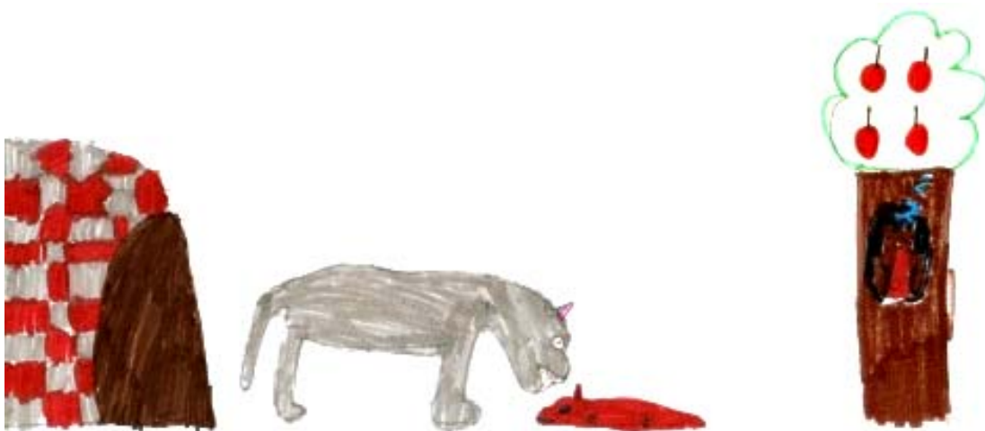
Figura 3.- Desenho de um lobo predador elaborado por um aluno do 2º ano.

A categoria "O lobo predador" (Figura 3) corresponde à percentagem de 7% (n=12) das ilustrações e mostra o lobo enquanto animal de topo da cadeia alimentar, a caçar ou a alimentar-se das suas presas, como animais (n=10) ou seres humanos (n=2), também evidenciando, neste último caso, as concepções que Cooper-Royer (2007) associou ao medo do lobo. Bettencourt et al. (2010) também classificaram poucos desenhos nessa categoria (8%).