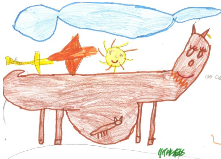
Figura 5.- Desenho de um lobo em gestação elaborado por um aluno do 2º ano.

A percentagem de alunos que elaborou desenhos com a localização do lobo no planisfério é de 5% (n=8). Verificou-se que os alunos não representaram de uma forma significativa "O lobo em cativeiro" (n=4), "O lobo e o caçador" (n=2) e "A reprodução do lobo" (n=2; Figura 5).