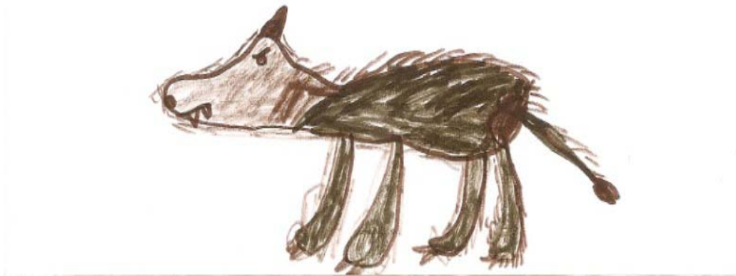
Figura 2. - Desenho de um "lobo mau" elaborado por um aluno do 1º ano.

(18%, n=30), vincando as características depreciativas que Cooper-Royer (2007) associou ao medo do lobo, como os dentes grandes e as orelhas pontiagudas (Figura 2).